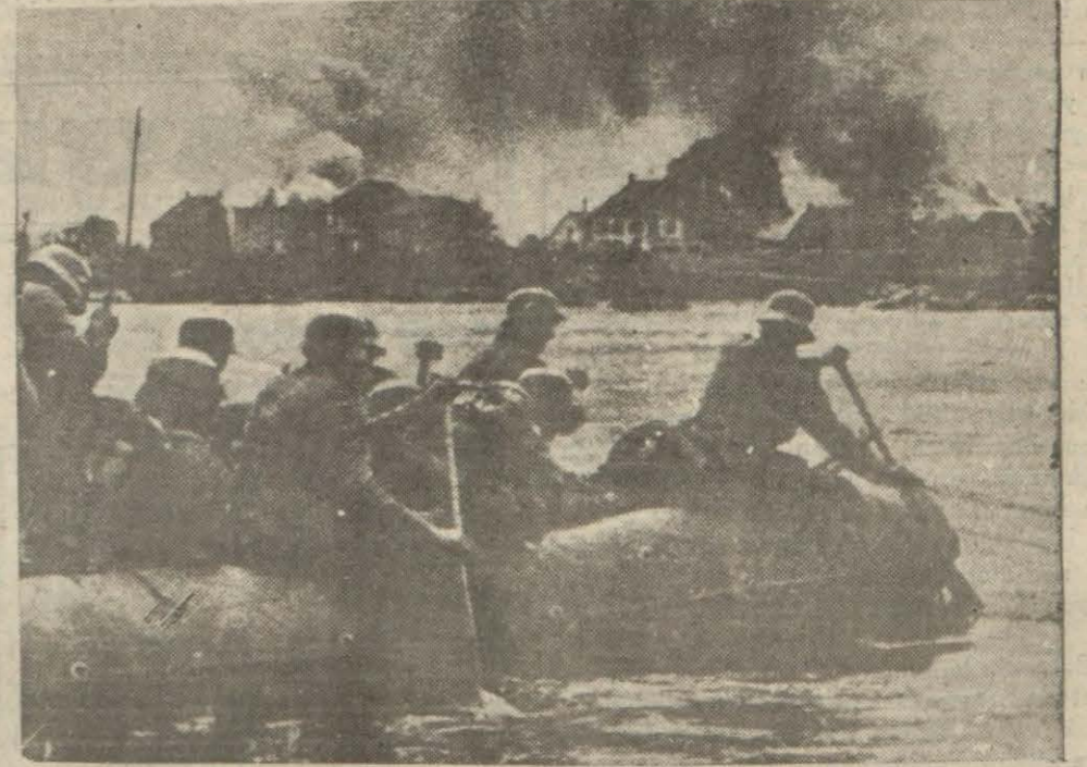
Almanlar Möz nehrini geçerek bombardımanlarla yaktıkları şehre doğru ilerliyorlar

(Maliye Vekâletinin tebliğini 3 üncü sayfamızda bulacaksınız)