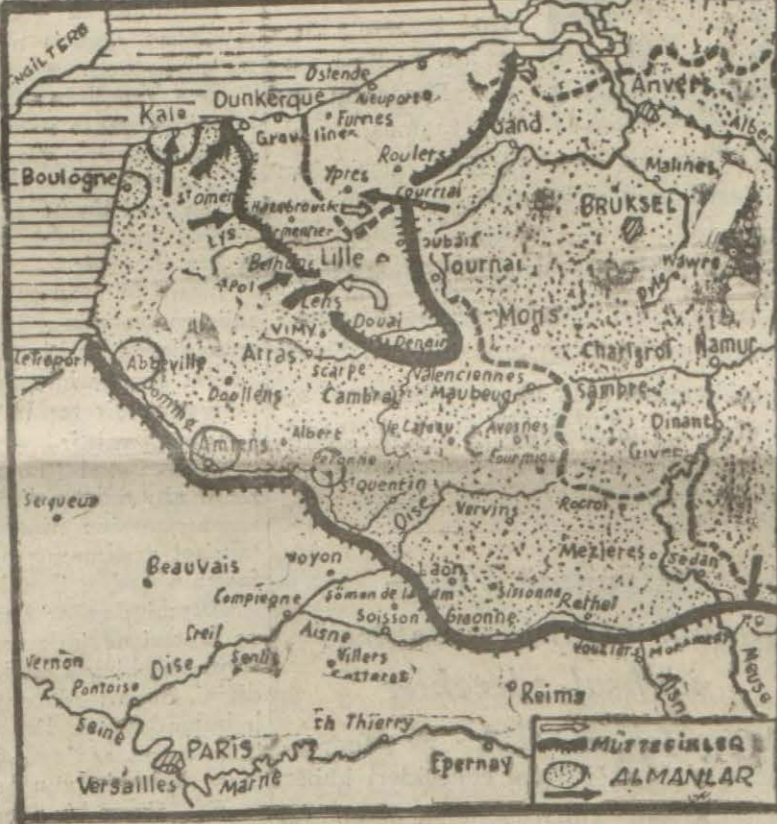
Dünkü vaziyeti gösterir kroki

General Weygand ilk ziyareti, Alman hatları üzerinden tayyare ile geçmek suretile yapmıştır. Generali hâmil olan tayyareye birçok avcı tayyareleri refakat et-