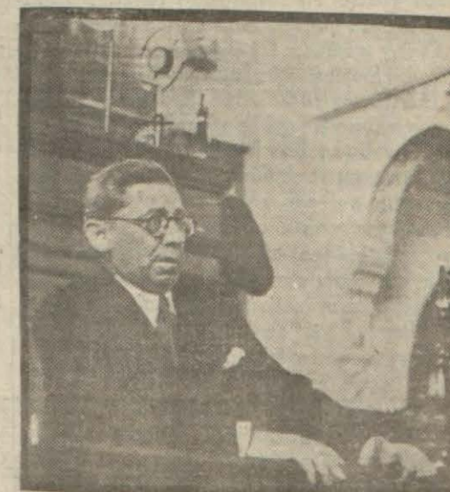
Maliye Vekili Meclis kürsüsünde

«— Bundan 9 ay evvel Avrupada bağıyan harbin tevid ettiği beynelmilel buhran, mall ve iktisadî sahadaki tesirlerini memleketimizde de göstermekte gecikmemiştir. Bir taraftan, gümrük vergileriyle gümrükte alınan diğer vergiler de tahminlerimizimize nazaran mühim bir noksanlık husulüne sebebiyet veren bu hal, diğer taraftan